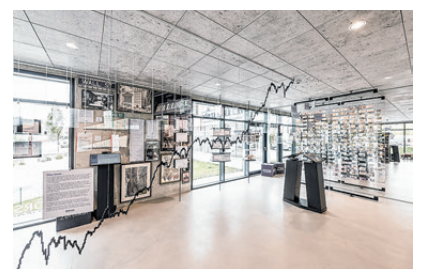
Börse zum Anfassen.

Das an das Verlagshaus angeschlossene „Haus der Börse“ beheimatet neben boerse.de, die boerse.de Vermögensverwaltung und im Erdgeschoss den Traum des Firmeninhabers Müller: die Pop-Art „Bulle 8 - Galerie“ und Deutschlands erstes Börsenmuseum. Hier kann man beispielsweise einmal echtes Frankfurter Börsenparkett betreten oder auf einer Original Kurstafel aus Düsseldorf schreiben. Ob jung oder alt, Börseneinsteiger oder Fortgeschrittener, das Börsenmuseum ist immer einen Besuch wert.