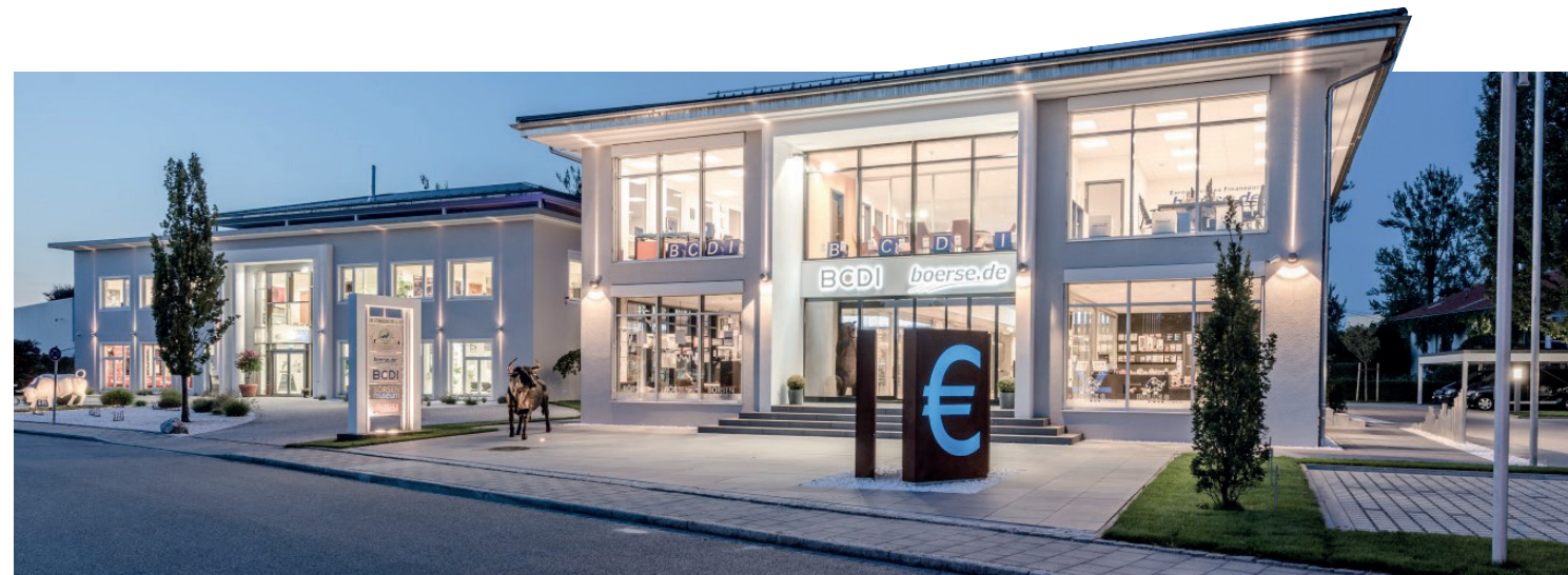
Beeindruckende Firmenzentrale: Verlagshaus mit Haus der Börse, der Heimat des ersten Börsenmuseums Deutschlands.